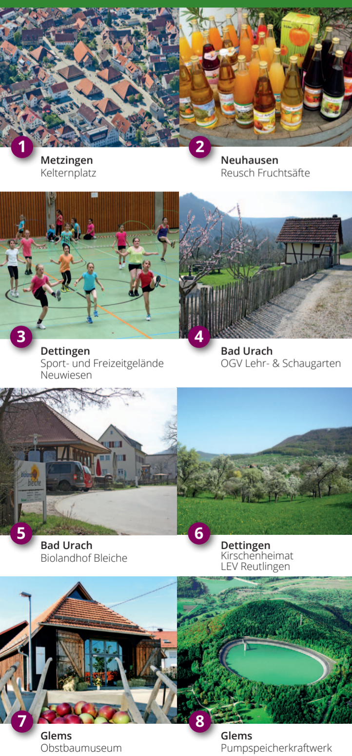
1 Metzingen Kelternplatz