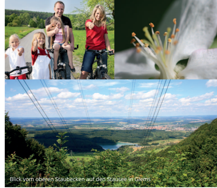
Blick vom oberen Staubecken auf den Stausee in Glerns

Auf zwei Rädern das wunderschöne Ermstal erkunden, dabei immer wieder an interessanten Orten Halt machen und es sich gut gehen lassen, dazu noch ein buntes Showprogramm genießen und zahlreiche Akteure und Themen kennenlernen, die den Begriff Nachhaltigkeit mit Leben füllen?