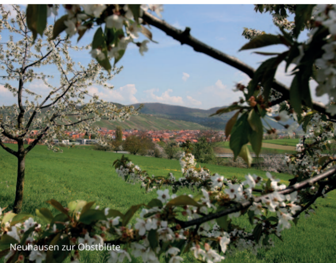
Neuhausen zur Obstölle